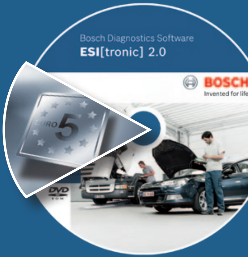
ESI[tronic] 2.0-Software und Steuergeräte Re-Programmierung: Unschlagbares Doppel