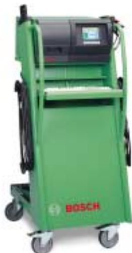
Bosch-Emissionsanalyse BEA 350 Für die schnelle und einfache Abgasuntersuchung