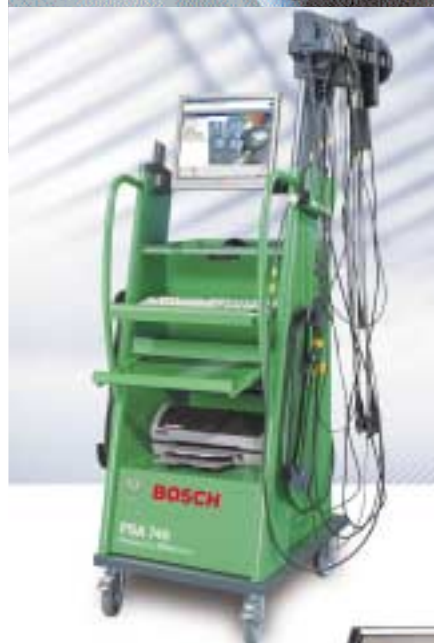
Bosch-Fahrzeug-Systemanalyse FSA 740 Der universelle Messplatz für die Werkstatt