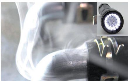
Weißes Licht lässt Abgase erkennen

Es kann aber auch ein auf 7 bar voreingestellter Stickstoffregler zur Verwendung mit größeren Stickstoffflaschen bestellt werden. Zum Anschluss an den SMT 300 wird dann ein Zylinderschlauch benötigt, der ebenfalls separat bestellt werden kann.