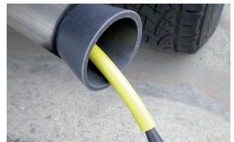
Der Leakfinder kann auch Undichtigkeiten im Auspuff-System finden